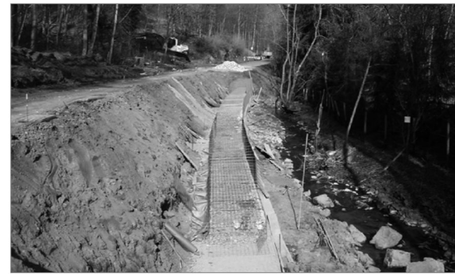
Bau der Gabionenwand

Die Landesstraße L 376 zwischen Meddersheim und Bärweiler wird auf einer Länge von 4,5 km ausgebaut. Der Ausbau unter Bauleiter Johannes Ziegel und Schachtmeister Alexander Rollheiser beinhaltet ca. 3,5 km Bestandsausbau mit Fahrbahnverbreiterung und ca. 1 km Vollausbau. Im Bereich des Bestandsausbaues wird eine teerhaltige, hydraulisch gebundene Tragschicht sowie eine