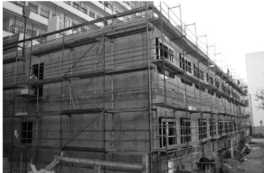
Rohbau kurz vor der Fertigstellung.

Der Auftraggeber, Verein Frankfurter Stiftungskrankenhäuser e.V. Frankfurt, setzt seit Jahrzehnten auf eine bauliche Weiterentwicklung des Krankenhauses, um die leistungsfähige und qualitativ anerkannte Medizin in modernen Räumen unterzubringen. Unter der Leitung von Bauleiter Henning Knauber wurden drei Geschosse in Richtung Süden des Gebäudes angebaut, so dass weitere Bettenkapazitäten für die Intensivstation, die Funktionsdiagnostik und Endoskopie des Bürgerhospitals untergebracht werden können. Dieser Anbau ermöglicht eine spätere Aufstockung. Für die Schal- und Betonierarbeiten sowie für den Kranbetrieb war unser Polier Achim Paulus mit einer Kolonne von durchschnittlich sechs Mann eingesetzt. So konnten in acht Monaten Bauzeit 1.500 m 3 Beton und 160 Tonnen Stahl verbaut werden. Der Keller wurde mit wasserundurchlässigem Beton als weiße Wanne ausgeführt, gegen das Bestandsgebäude